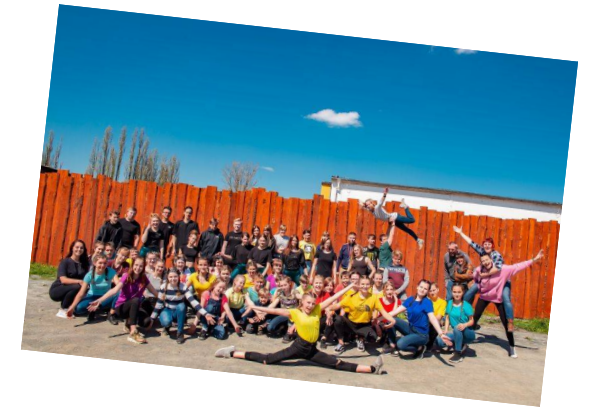
Tanzprojekt „Schule tanzt“ 2019

Home: www.lessing-oberschule-schkeuditz.de